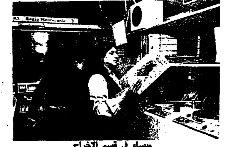
ميسام في قسم الإخراج

و «مونتى كارلو» التي أحدثت المعالم العربى بدقة تائها ، بسرعة خبرها ، برشاقة مديفها ، والتي خلقت جسرا من التواصل الإخبارى ، الثنائى والفنى بين المواطن العربى وأحداث العالم ، تدهشى أكثر زائرها في باريس - سيكتشف الزائر أن كل هذه الصعوبة ، وكل هذا النجاح يقتصر فعلة على امرأة صغيرة ، مكافئة - بدأت «مونتى كارلو» العمل فعليا سنة